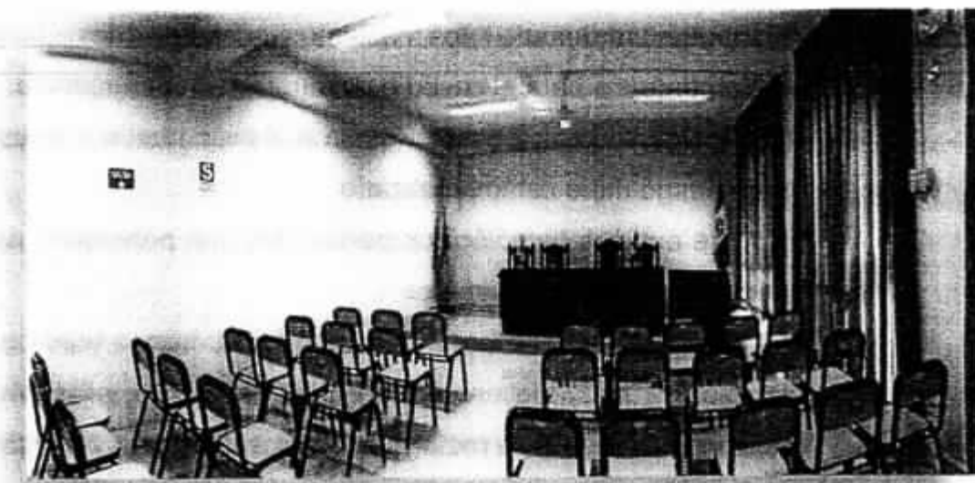
SALA DE SIMULACIÓN DE AUDIENCIAS